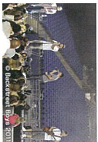
2011年オアシア公演でのV.I.Pの様子